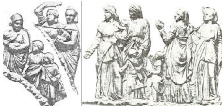
Dakische Frauen von der Trajanssäule

Ein Grabdenkmal eines Paares zeigt die Frau in einem schlichten, von einem breiten Gürtel mit lang herabhängendem Ende zusammengehaltenen engen Chiton (unter dem wahrscheinlich eine Chamisia getragen wurde), Umhang und kopftuchartigen Haube. Darstellungen von der Trajanssäule zeigen eine ähnliche Tracht, nur dass Kleider und Kopfbedeckungen nicht ganz so schlicht dargestellt sind. Die Säule könnte also die Trachten dakischer Frauen durchaus zutreffend wiedergeben.