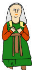
◀Pannonisches Mädchen pannonische Schleierhaube▶