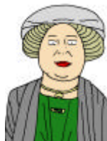
Norische Haube 2

Der Schmuck besteht wieder aus Halsring mit Lunula, dazu fast immer einer Halskette; seltener sind Armring, Brosche und Brustschmuck. An den Schultern wurden zwei Fibeln getragen. Die zweite Haubenform ist auf das Gebiet von Flavia Solva beschränkt, mit einzelnen Ausläufern nach Virunum, Celeia und Poetovio.