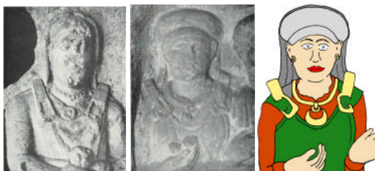
nordostpannonischer Turban mit Schleier