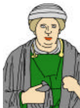
Norische Haube 1

Die Verbreitungskarte zeigt eine Konzentration im Gebiet von Virunum, mit vereinzelt Ausstreuen nach Celeia, Poetovio, Flavia Solva in der einen und Iuvavum, Ovilava, Lentia in der anderen Richtung.