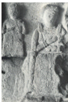
Relief einer sitzenden Frau aus dem Leithawinkel

Einen Überblick über die norischen und pannonischen Trachtzentren mag eine Kartenskizze von Garsch (s. Literatur) geben. Er schreibt dazu: